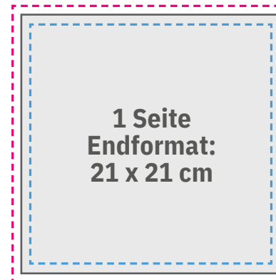
Sichere Druckzone: 20 x 20 cm Beschnittformat: 21,6 x 21,6 cm