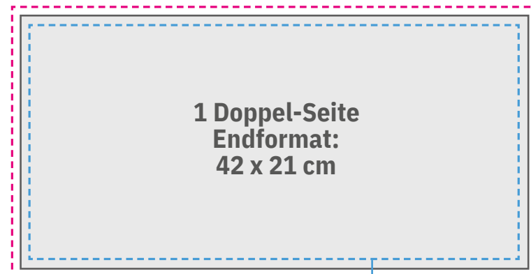
Sichere Druckzone: 41 x 20 cm Beschnittformat: 42,6 x 21,6 cm

+ 3 mm pro Rand Beschnittzugabe auf Endformat-Größe dazugeben (werden in Produktion wieder abgeschnitten)